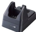
Интерфейсная коммуникационная подставка/зарядное устройство