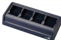
Зарядное устройство на 4 слота